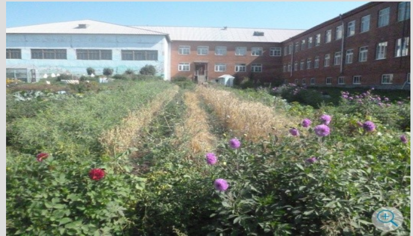
МОУ Алятская СОШ 30 ноября 2016 года