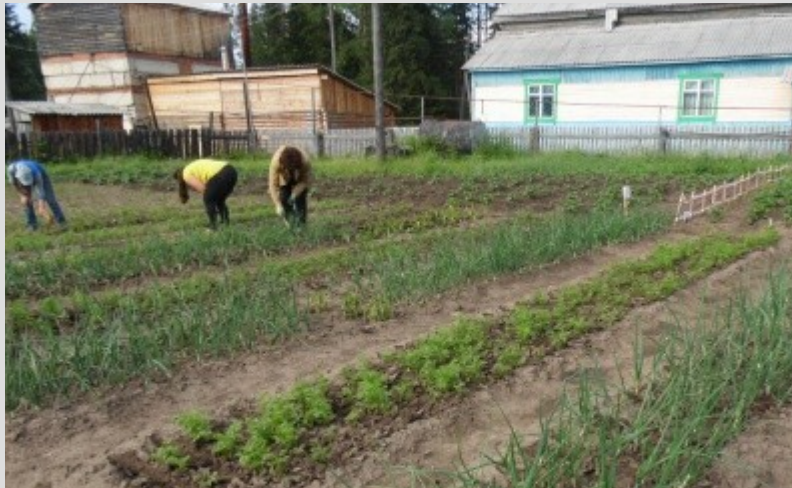
МБОУ ООШ д. Кулиш 19 августа 2016 года