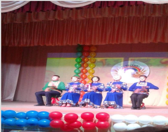
Центр образования «Альянс» 16 сентября 2017 года